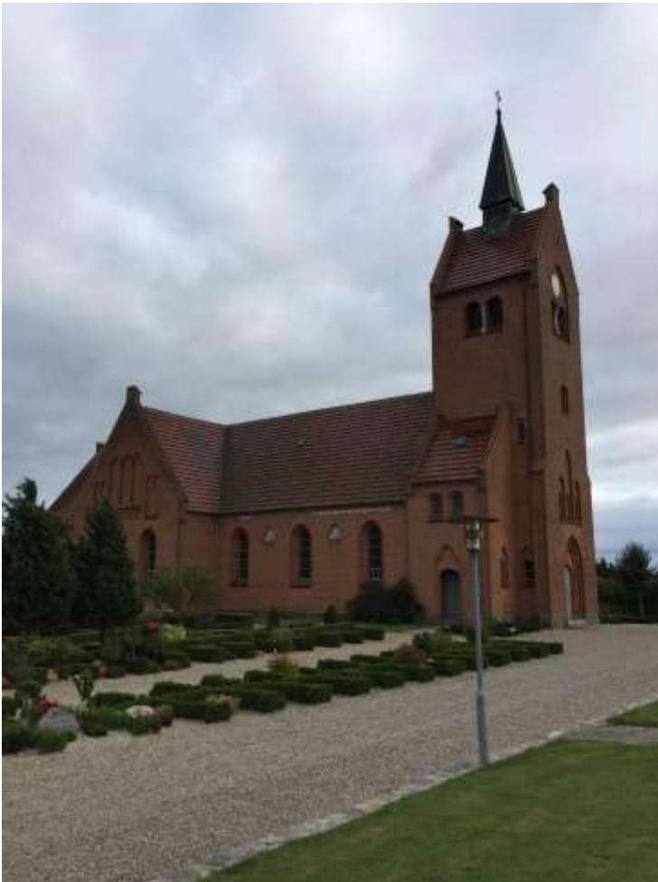
Bjerreby kirke på Tåsinge – fotograferet september 2019