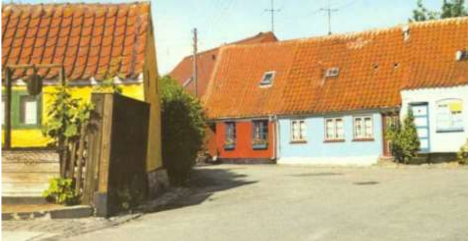
Morfars barndoms hjem i P.M gang nr 6 i Marstal (Røde hus - 1988