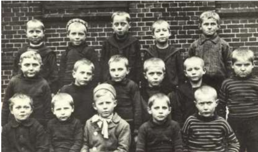
Klassebillede: Morfar er yderst til højre i 2. række.

Før morfar kom til at arbejde på gasværket, kom han, som de fleste andre marstaldrenge ud at sejle efter konfirmationen i foråret 1920. Han sejlede i 6 år og var i denne periode kun med to skibe: "Daggry" og skonnerten "Avance", begge fra Marstal. Det var på dette tidspunkt, lige efter 1. verdenskrig, at sejlskibsæraen var ved at slutte, og dette illustreres bl.a. ved at Avance i 1921 fik påmonteret hjælpemotor. På disse sejlskibe var der normalt en 3-4 mands besætning, og morfar startede som dreng på skibet, hvor han bl.a. skulle tage sig af madlavningen, hvilket mormor i dag undrer sig en del over, at han kunne klare. Morfar erindrer også en rejse, hvor skibet efter endt vinterhi, netop havde forladt Marstal for at begive sig til Nykøbing F. i ballast. Da de rundede Langeland havde skibet så stærk hældning, at vandet var ved at løbe ind over rælingen, hvorpå morfar sagde til skipperen, at han var bange for, at det skulle gå galt. Skipperen svarede ham blot selvsikkert, at skibet selvfølgelig ikke ville hælde mere. Dette fortæller noget om, hvor stor søkyndighed disse skippere havde på disse sejlskibe.