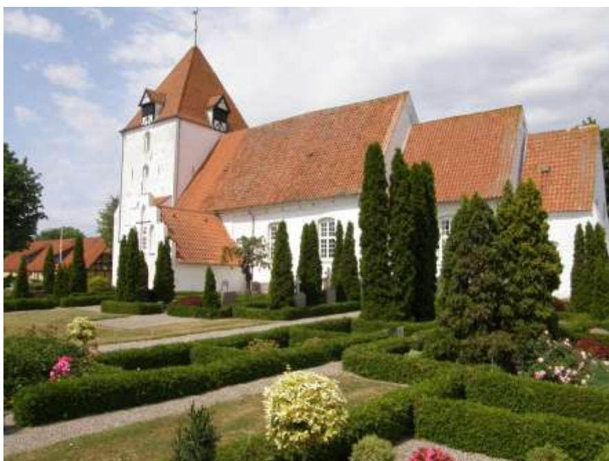
Sandby kirke Fotograferet sommer 2017)