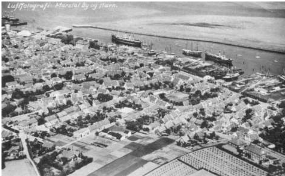
Marstal by og havn 1933.