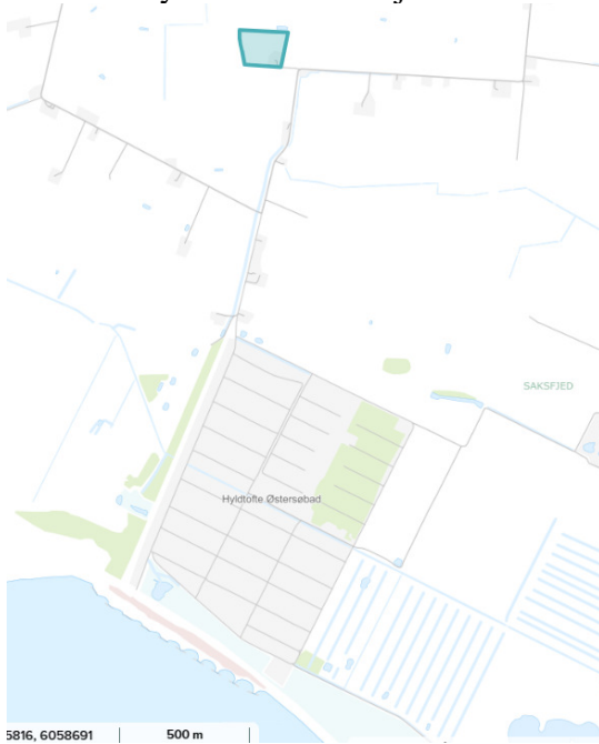
Matrikel Hyldtofte 24 Bjerremark