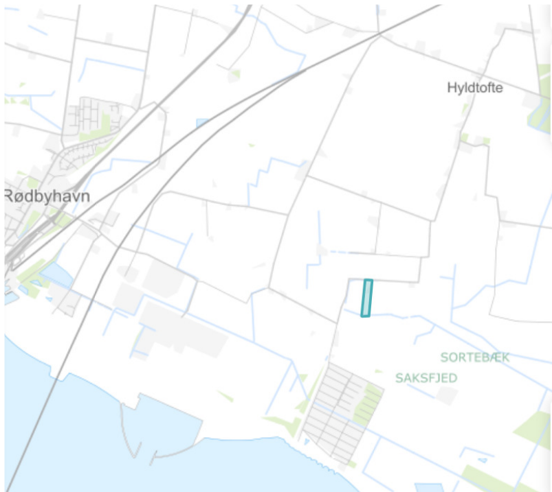
Matrikel Hyldtofte 29kk i Bjerremark