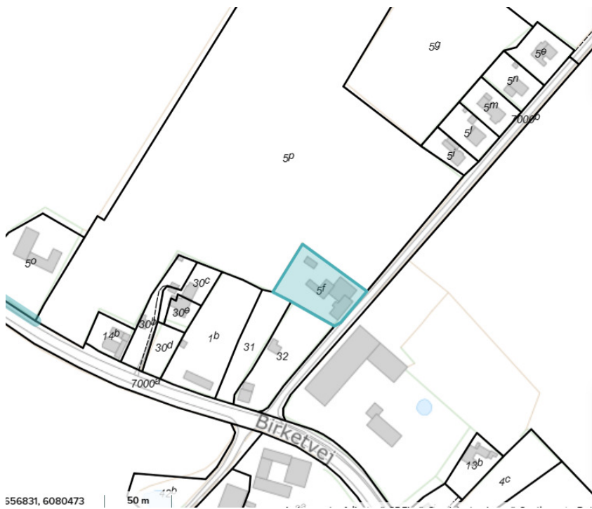
Matrikel 5f i Reersnæs, Bandholm