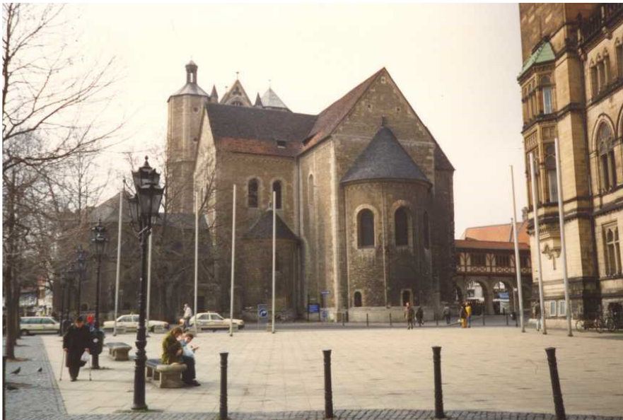
Braunschweig – domkirken – fotograferet 1990